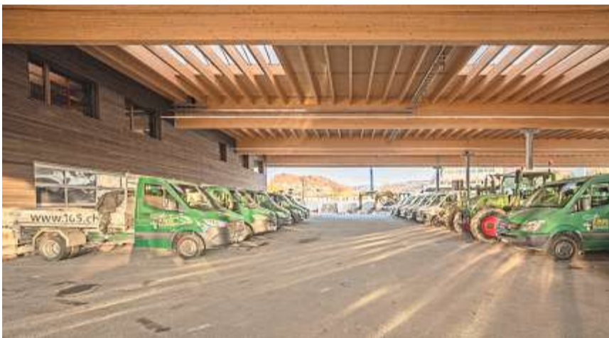
Dank des überdachten Umschlagplatzes kann auch bei Regen und Schnee effizient vorbereitet sowie auf- und abgeladen werden.

21-jähriger gelernter Forstwart seinen Ein-Mann-Betrieb gründete und heute mit seinen zwei Firmen rund 45 Mitarbeitende beschäftigt. Und der innovative Unternehmer denkt bereits weiter: Geprüft wird ein Angebot zur Verpflegung über den Mittag im Gewerbetpark für die nähere Region.