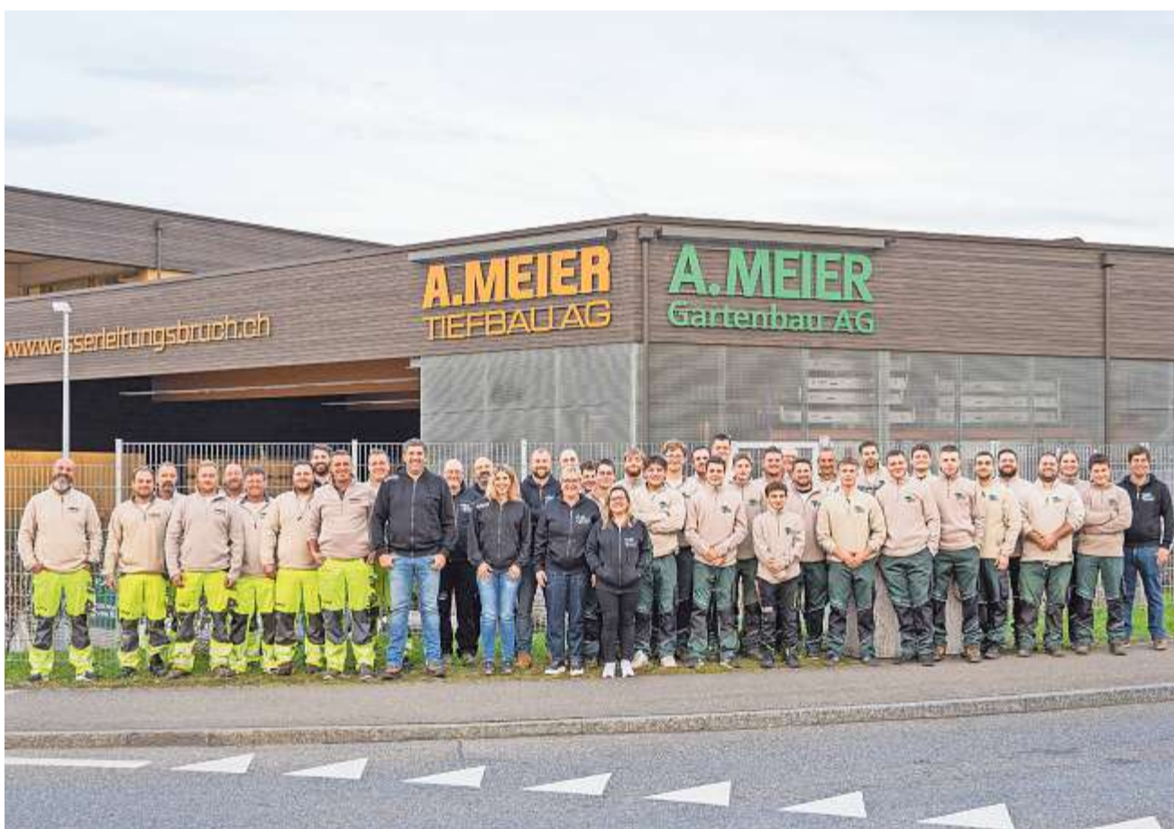
Das Meier-Team steht für Gartenbau und Tiefbau und ist dank dem neuen Gewerbepark in Zukunft noch effizienter.

schoss erste Mietflächen bereits während der Bauphase bezogen werden: die Sandmeier Fleisch und Feinkost AG aus Kölliken mit einem Kühlager und die benachbarte Jungheinrich AG aus Hirschthal mit Lagerplatz. Zudem wurden erste Wohnmobil-Parkplätze vermietet. Per 10. November 2025 hat der Regionale Sozialdienst (vormals in Unterentfelden ansässig) seinen Bürobetrieb im Gewerbepark aufgenommen. Die weiteren Mieter folgen per Ende Jahr: Die Eiger Diamant AG aus Holziken, die H. Frey AG aus Kölliken und die SL Keramik GmbH aus Muhen nehmen ihren Betrieb in den Workboxes auf und die Waser Works AG aus Urdorf ZH bezieht ihr Büro im 2. OG. Damit sind alle Gewerbe- und Büroflächen wie auch die Wohnmobil-Abstellplätze zu 100% vermietet. Der Gewerbepark stärkt Hirschthal und die Region wirtschaftlich.