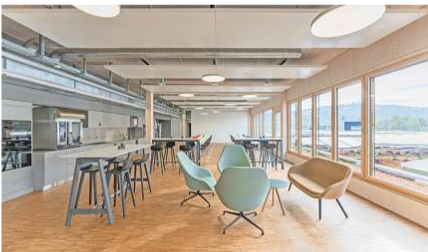
Der Aufenthaltsraum mit Küche und Begegnungszonen sowie die Terrasse mit Rundum-Sicht fördern den Austausch und das Miteinander.