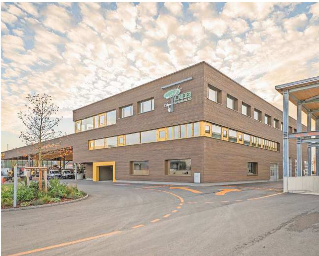
Links geht's zu den Besucherparkplätzen und zum Umschlagplatz, rechts zur Anlieferung und nach unten in die Tiefgarage.