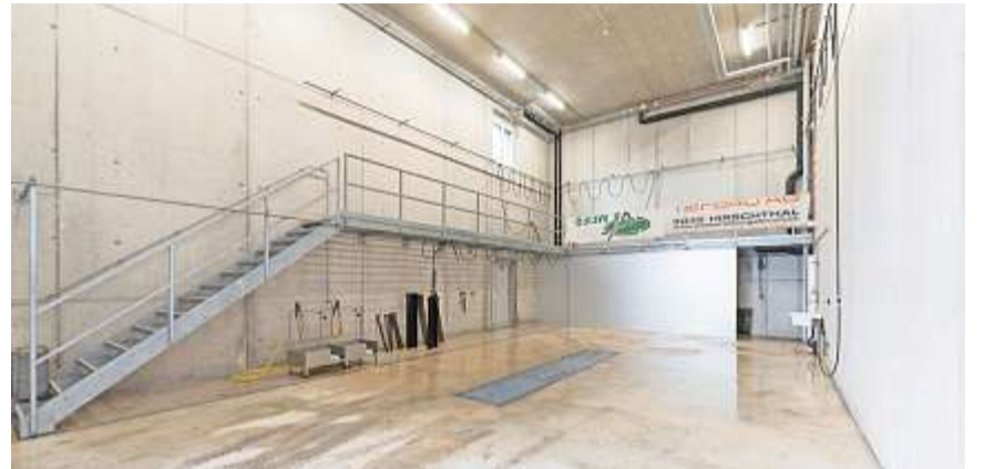
Die integrierte Wäschehalle für die Meier-Fahrzeuge und -Baumaschinen.

Den Mitarbeitenden der beiden Meier-Firmen steht neu eine riesige gedeckte Fläche als Umschlagplatz zur Verfügung, die vor dem Wetter schützt. So kann auch bei Regen oder Schnee optimal vorbereitet, aufgeladen und abgeladen werden. Sogar die Wäschehalle für die Fahrzeuge ist überdacht. Es gibt Schuhtrockner, einen Trocknungsraum und eine Terrasse fürs Feierabendbier. Ein grosser Ausstellungsraum, der zusammen mit der H. Frey AG und der SL Keramik GmbH realisiert wird, lädt künftig zur Inspiration ein. «Das Ziel war es immer, das Material und den Maschinenpark unserer bislang verschiedenen Standorte zu konsolidieren und dadurch die Effizienz zu steigern», erklärt Adi Meier den Grund des Gewerbeparks. Dass durch die vielen Optimierungen in den Arbeitsabläufen und im Materialhandling auch die Motivation des Personals gesteigert wird, kann der Kundschaft nur zugutekommen. «Denn deshalb haben wir diesen Gewerbepark realisiert: für beste Arbeitsbedingungen, beste Qualität und beste Kundenzufriedenheit», sagt Adi Meier, der im Jahr 1999 als