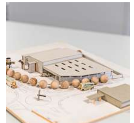
Aus dem einstigen Modell wurde ein imposanter Gewerbebau, in dem ab 2026 rund 100 Menschen arbeiten werden.