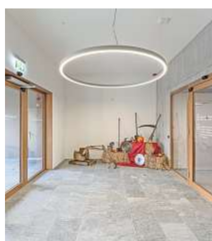
Der grosszügige und helle Eingangsreich.