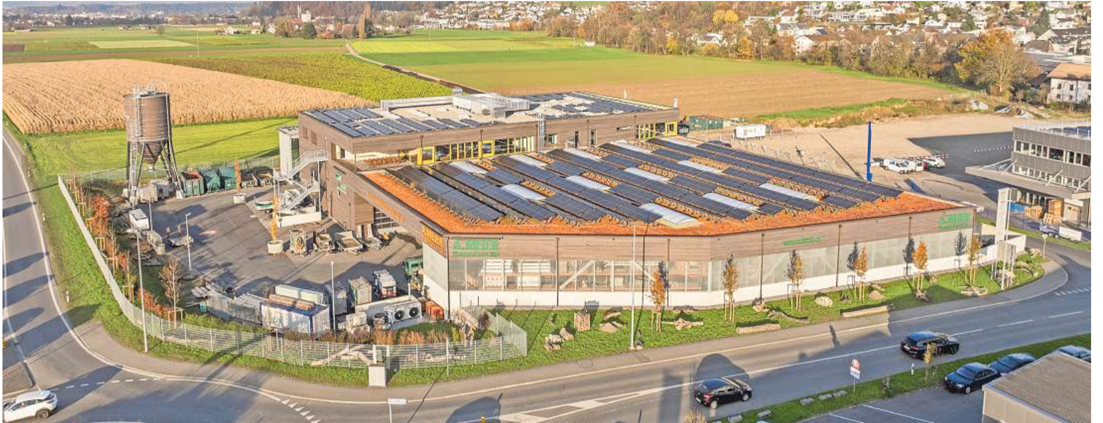
Der Gewerbepark befindet sich beim Kreisel an der Achse Suhrentalstrasse/Holzikerstrasse in Hirschthal.