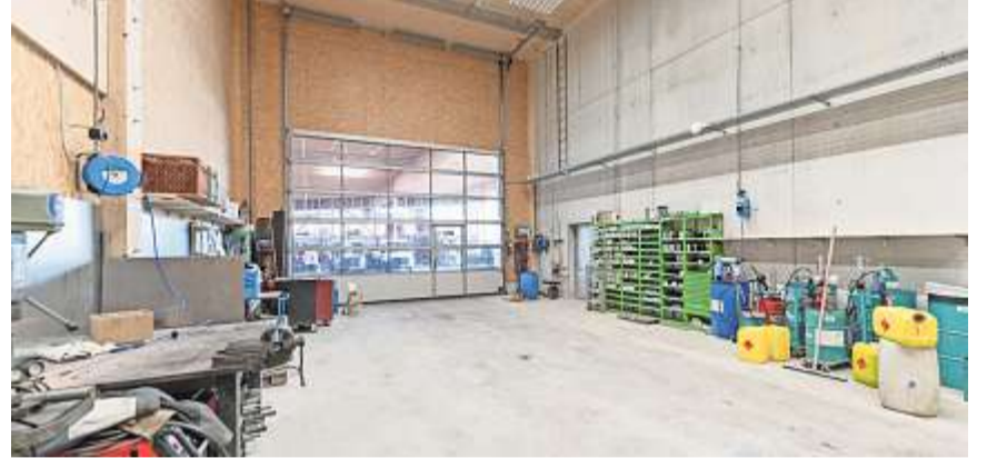
In der eigenen Werkstatt werden Fahrzeuge und Maschinen gewartet und repariert.