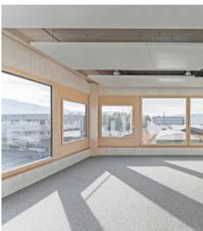
Räume mit Weitsicht, viel Holz und modernem Ambiente.